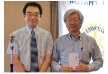
野ORフェローシップカウンセラーにクラブから記念品の贈呈